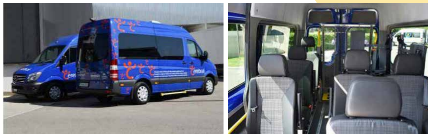
Mercedes-Benz Automobiles SA à Schlieren : Tél. 044 738 38 14 dès CHF 50. -/jour

Location de minibus adaptés : Nous louons des véhicules modernes accessibles en fauteuil roulant à des institutions et des familles. Les minibus satisfont aux standards les plus élevés en matière de sécurité et disposent tous d'un système de retenue pour fauteuils roulants. Ils peuvent être loués facilement pour des sorties à la journée, ou pour quelques heures seulement.